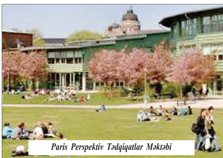
Paris Perspektiv Tədqiqatlar Məktəbi