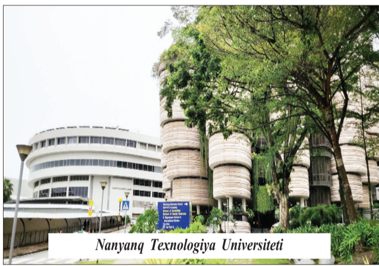
Nanyang Texnologiya Universiteti