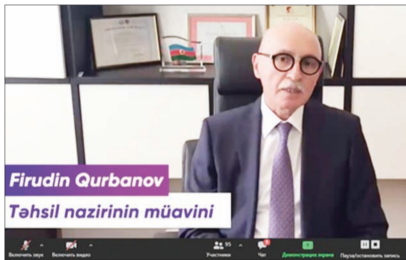
Firudin Qurbanov Təhsil nazirinin müavini

2019-2020-ci tədris ilində bakalavr və magistratura səviyyələri üzrə 450-yə yaxın gənc məzun oldu