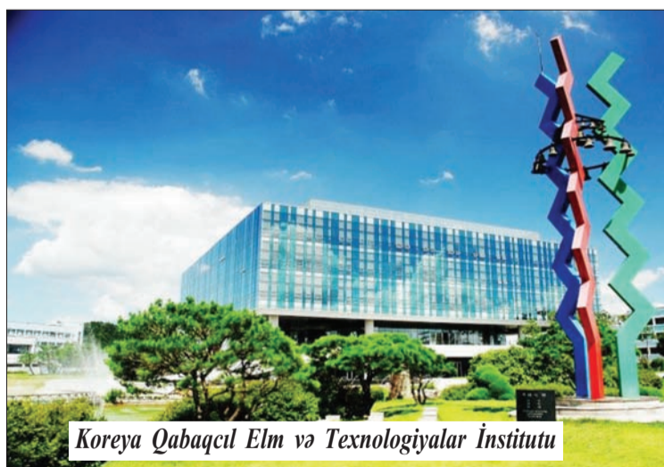
Koreya Qabaqcıl Elm və Texnologiyalar İnstitutu